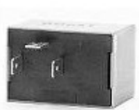
14.25 Lampeggiatore Elettronico di Direzione ed Emergenza