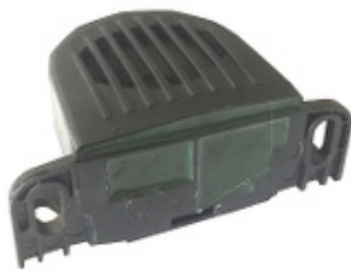
14.21 Avvisatore Acustico di Retromarcia