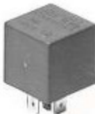
14.27 Lampeggiatore Elettronico di Direzione ed Emergenza