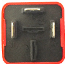
14.23 Intermittenze con Diagnosi