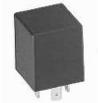
14.24 Lampeggiatore Carico Duplice Direzione e Emergenza per Vetture con Traino