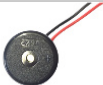
14.22 Buzzer da Interno